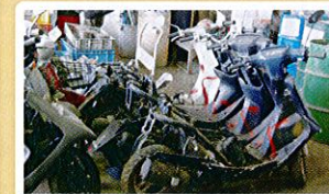
解体された二輪車