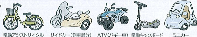
電動アシストサイクル サイドカー(側車部分) ATV(バギー車) 電動キックボード ミニカー